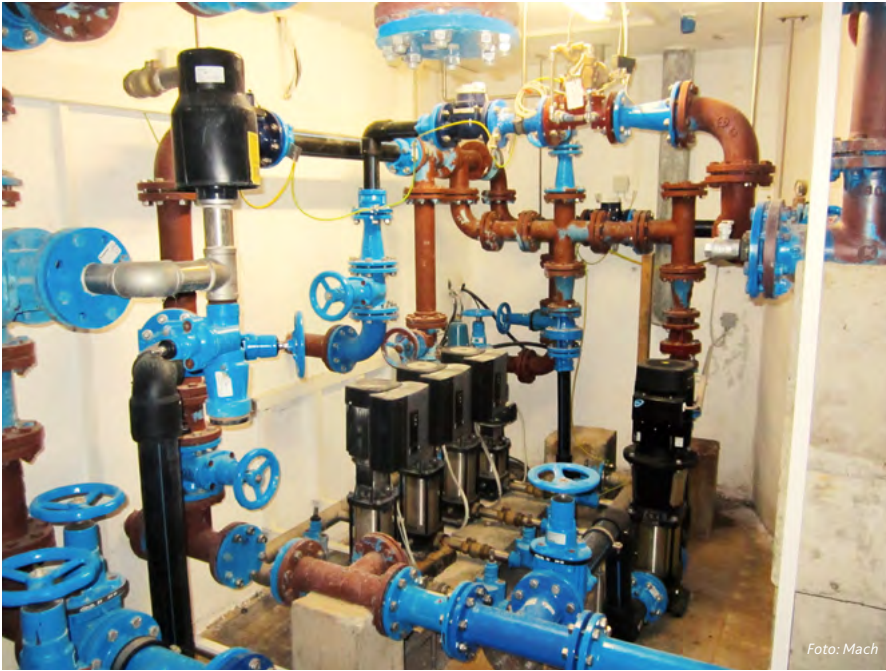
Beispiele von Armaturen in der Wasserversorgung