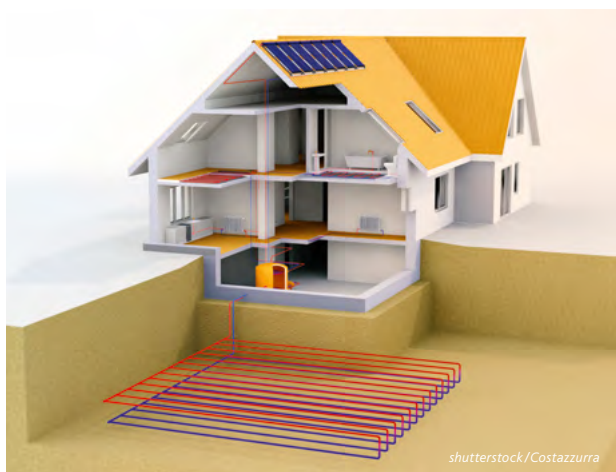
Wärmepumpe mit Erdwärme-Flachkollektor.

Eine Wärmepumpe funktioniert ähnlich einem Kühlschrank, wo in einem geschlossenen Kreislauf ein Arbeitsmittel zwischen Verdampfer und Verdichter (Kompressor) zirkuliert, und die gewonnene Energie an einen Heiz- bzw. Kühlkreis abgibt.